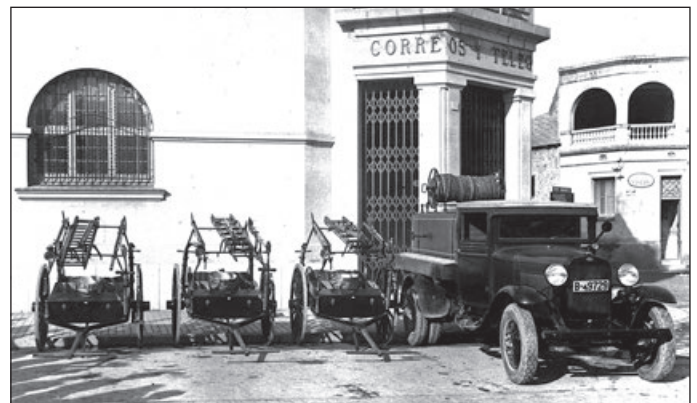
Vehícle i carros portamànegues dels Bombers de l'Hospitalet de Llobregat el 1934

A partir del juny del 1939, com que l'Ajuntament de l'Hospitalet de Llobregat no va voler assumir novament l'organització dels bombers, el Servei d'Extinció d'Incendis i Salvaments de l'Ajuntament de Barcelona es va fer càrrec dels serveis a l'Hospitalet des de les seves pròpies casernes. Així, la ciutat del marge esquerre del riu Llobregat no va tornar a tenir un servei propi de bombers fins al 1975, quan la Diputació de Barcelona va obrir-ne un parc al carrer Masnou, amb una dotació de trenta-sis homes. Aquest parc es va integrar als Bombers de la Generalitat el 1980, quan Catalunya va assumir les competències d'extinció d'incendis i salvaments.