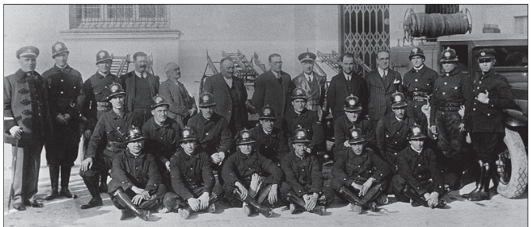
Bombers de l'Hospitalet de Llobregat amb autoritats civils el setembre del 1936

Aquesta caserna funcionava com totes les altres, amb tres torns diaris: de les set del matí a les dues del migdia, de les dues a les nou del vespre i de les nou a les set del matí de l'endemà. En cada torn hi havia, generalment, un preferent (assimilat avui en dia a caporal) i cinc bombers rasos, un dels quals, procedent dels torns del Parc Central, pertanyia als Bombers de Barcelona.