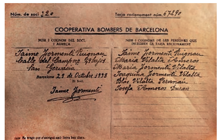
Carnet de soci de la cooperativa

La cooperativa va arribar a tenir més de 360 persones associades, la majoria de les quals eren membres del cos de bombers, que s'integraven a la cooperativa amb les seves famílies, tot i que també hi havia socis que no eren bombers. Tothom tenia una targeta de racionament per tal d'adquirir