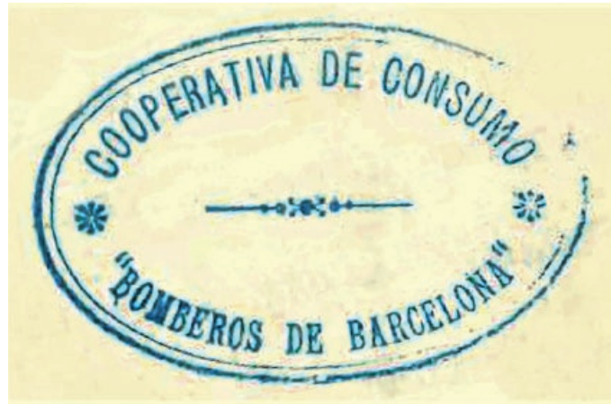
Segell de la Cooperativa de Bombers de Barcelona

La vida s'anava encarint i els salaris no van seguir la corba ascendent dels preus, de manera que la majoria de la població va perdre poder