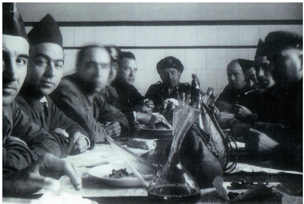
Un grup de bombers de guàrdia durant la Guerra Civil.