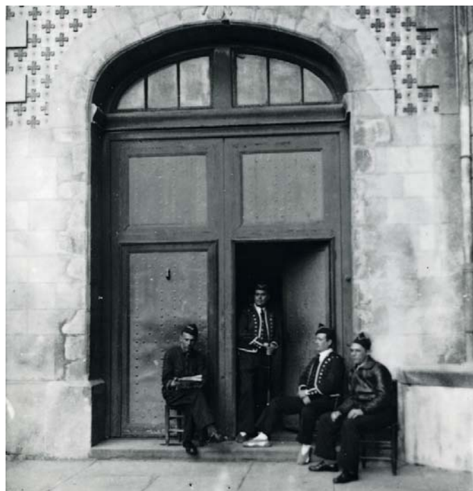
El cos de guàrdia de la Comissaria de Museus vigila la porta de la capella del Santíssim de l'església de Sant Esteve d'Olot el novembre del 1936. El cos estava format per dos mossos d'esquadra i dos bombers de Barcelona.

Els bombers eren rellevats mensualment entre el 9 i el 12 de cada mes, en un viatge que començava anant en tren fins a Ripoll des de l'Estació del Nord de Barcelona; després, de Ripoll a Olot, el trajecte es cobria amb el bus de línia. Alguns bombers, però, en lloc d'estar-s'hi un mes se n'hi van van estar dos, i també n'hi va haver que alguna vegada van repetir. Pràcticament cada mes, el cap del Cos de Bombers de Barcelona, Josep Maria Jordán, anava fins a la capital de la Garrotxa per