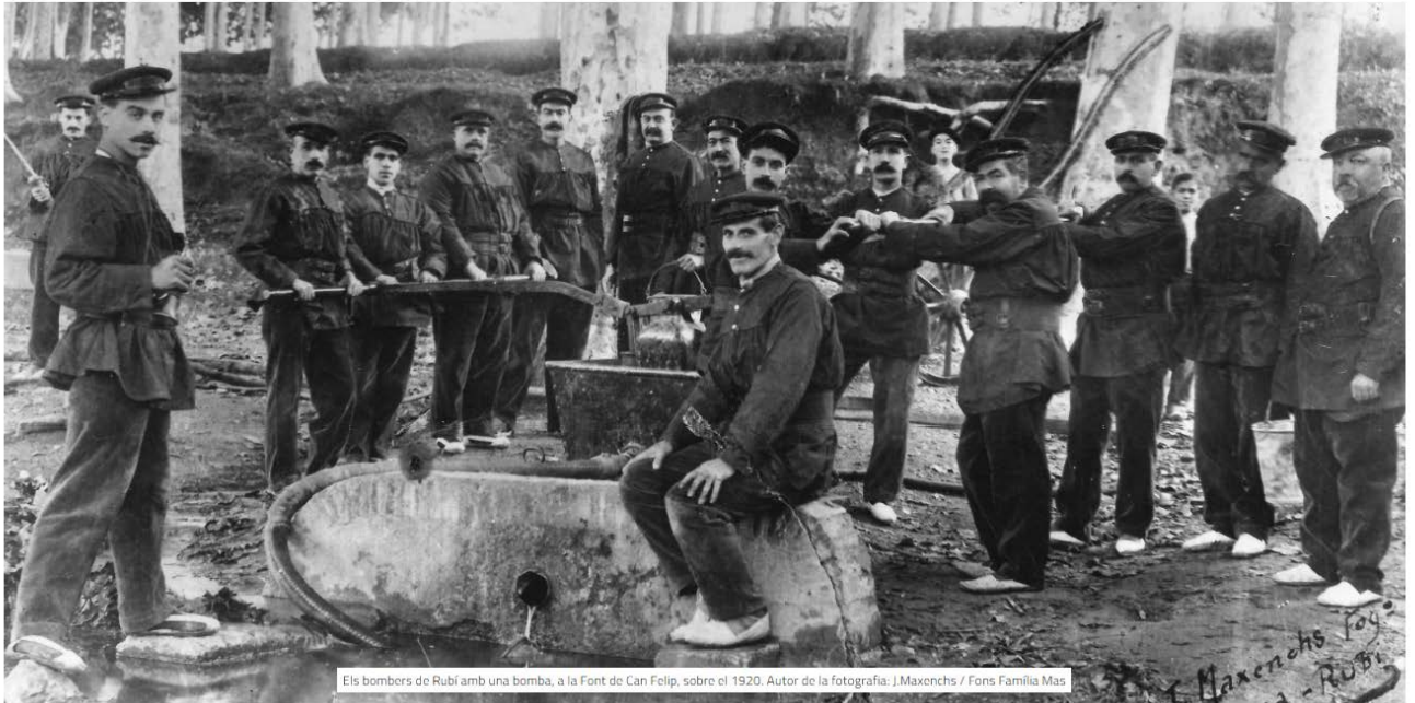
Els bombers de Rubí amb una bomba, a la Font de Can Felip, sobre el 1920.