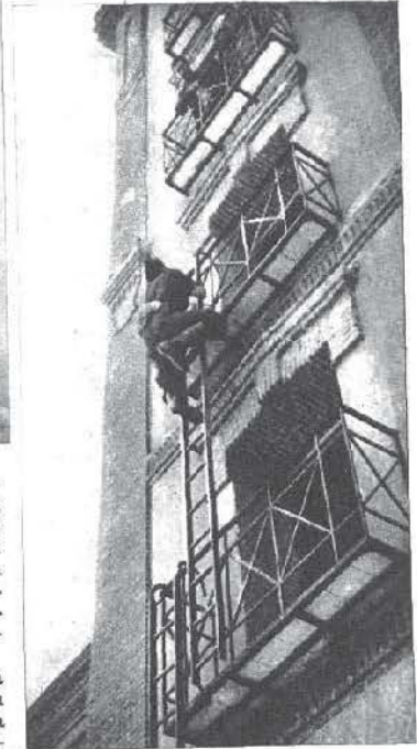
La ascensión, por medio de escalas, a un piso alto ↓