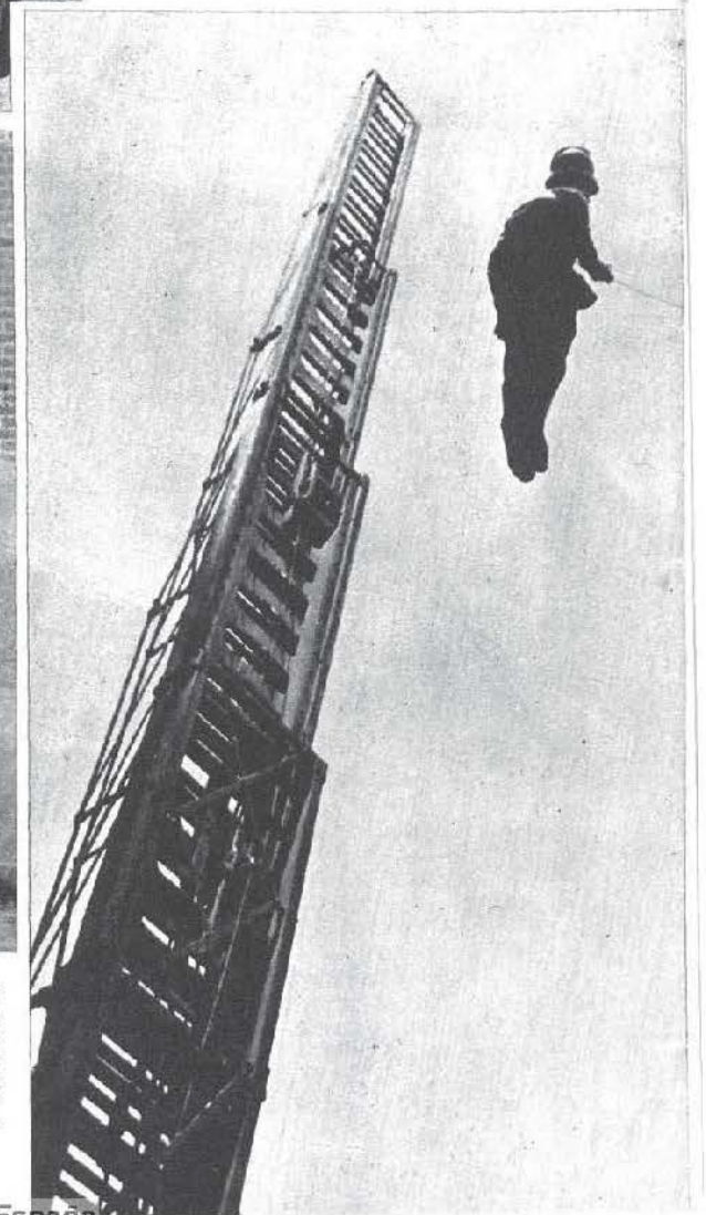
Prácticas de los bomberos en un Parque de Madrid: el descenso por la cuerda, desde una altura considerable →