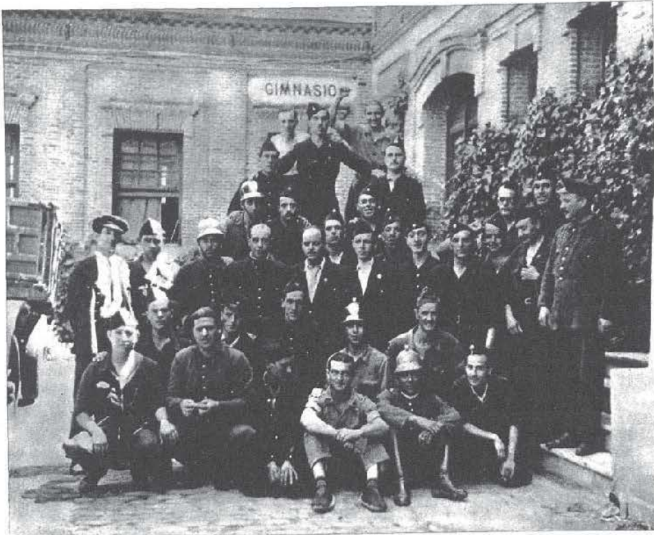
He aquí a los bomberos catalanes, junto a sus camaradas de uno de los Parques de Madrid