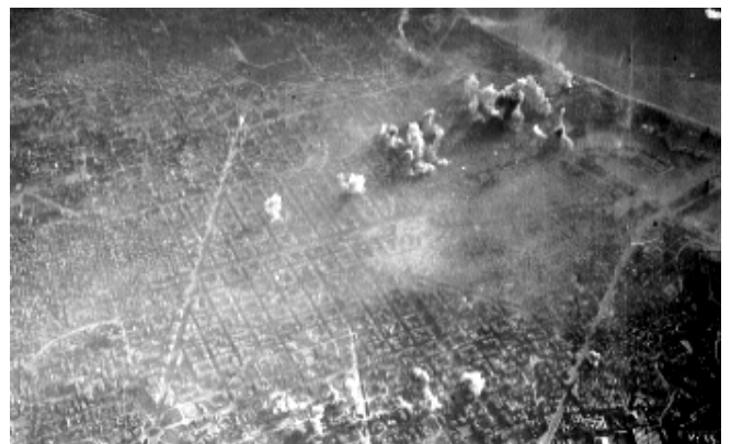
Bombardeig de Barcelona el 17 de març de 1938, a les 07:40

camió, arrasant tot el que va poder. La deflagració va ser enorme i va crear una columna de fum d'uns 250 metres d'alçada. A més van començar a cremar una sèrie de cases i